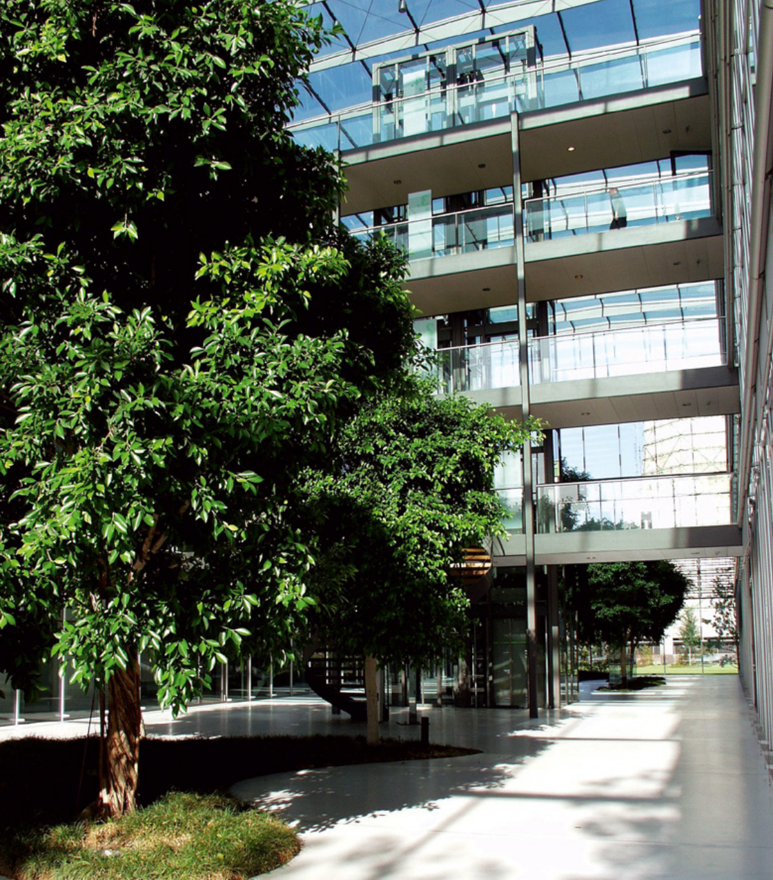
Hauptverwaltung Höherweg (Atrium)